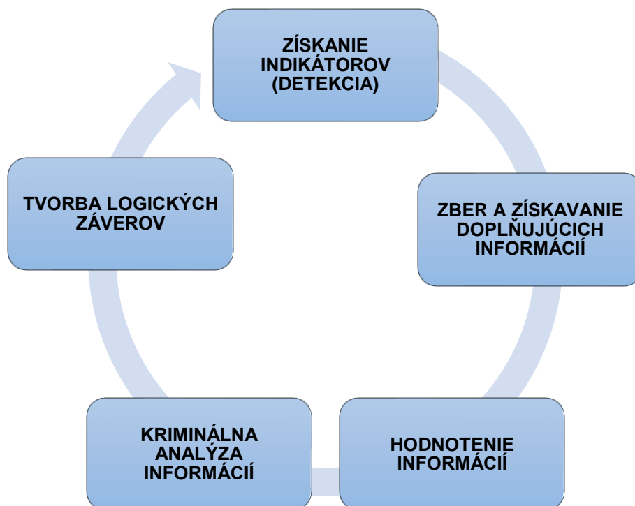
Obrázok 2: Znázornenie postupnosti činností vykonávaných pri odhaľovaní TČ

Operačnú úroveň odhaľovania trestných činov je potrebné chápať ako procesuálnu, poznávaciu, cyklickú činnosť vo vzťahu ku konkrétnym prípadom trestnej činnosti , k hrozbám a prioritám identifikovaných strategickou úrovňou odhaľovania. Z pohľadu obsahu je operačná úroveň odhaľovania postavená na práci s informáciami v informačnom cykle (spravodajskom cykle). Teoretické vymedzenie odhaľovania trestných činov je súčasťou teórie bezpečnostných vied , ktorá odhaľovaním trestnej činnosti označuje také činnosti, ktoré sú vykonávané k zisteniu samotnej existencie skutku, ktorý je možné kvalifikovať ako trestný čin a ktorý nebol oznámený orgánom polície (resp. určených orgánov finančnej správy) a nie je ani inak evidovaný v príslušných štatistikách. Z pohľadu bezpečnostnej teórie odhaľovanie má povahu poznávacej činnosti (poznávacieho cyklického procesu), kde zo štádia neznalosti sa postupuje ku konkrétnemu poznaniu, ktorý je možné graficky znázorniť nasledovne: