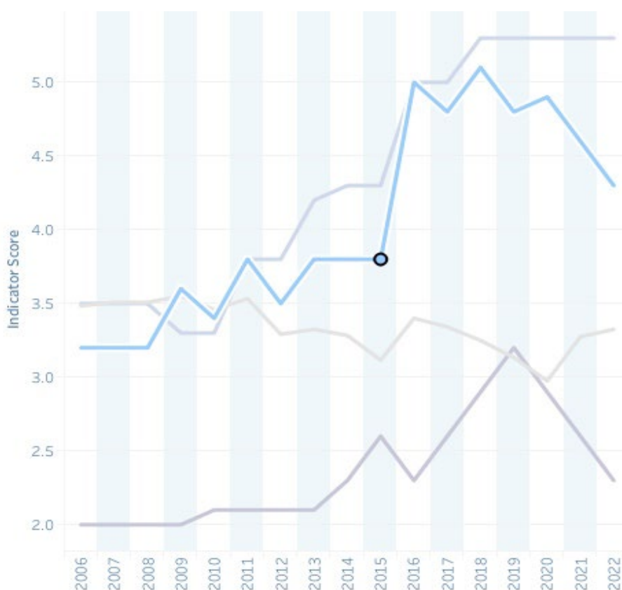
Graf č. 2: Indikátor skupinové polarizace