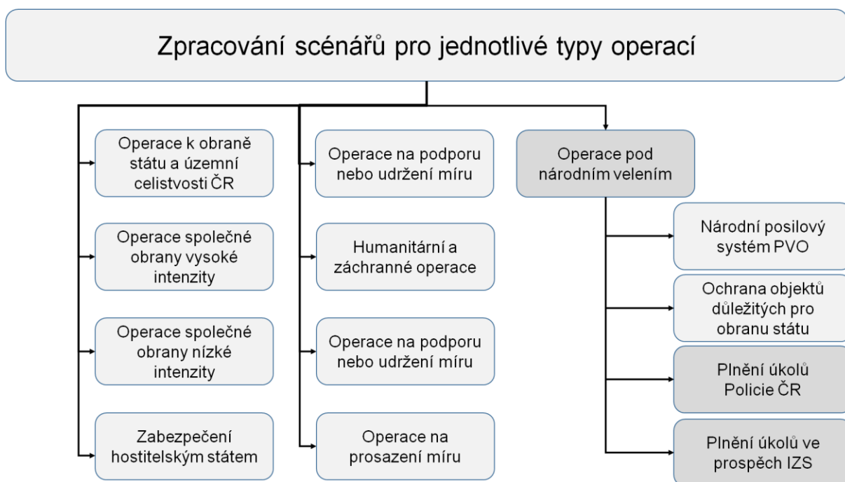
Obrázek 1 Zpracování scénářů pro operace

Na otázku proč využít metodu psaní scénářů ve vojenském prostředí je možné nalézt více odpovědí. Jeden z klíčových důvodů je správné naplánování využití sil a prostředků Armády ČR. Neméně důležitým důvodem je zkvalitnění spolupráce jednotlivých složek provádějících záchranné a likvidační práce v rámci dané operace. Jednoduchou a rychle využitelnou metodou, která v případě vzniklé krizové situace umožňuje okamžitou spolupráci, jsou jednoznačně scénáře. K tvorbě budoucích scénářů přispívá i Centrum bezpečnostních a vojenskostrategických studií Univerzity obrany (CBVSS UO) v rámci projektu „Strategické alternativy výstavby a rozvoje ozbrojených sil ČR“ (STRATAL). Cílem projektu je rozpracování modelových scénářů a následně zpracování metodiky jejich tvorby v Armádě ČR. Metodika bude využívána pro tvorbu jednotlivých scénářů pro strategické plánování a tvorbu koncepčních dokumentů.